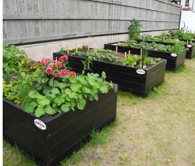
Odningsslådor i kvarteret Drivbänken är resultatet av ett av FaBos projekt.